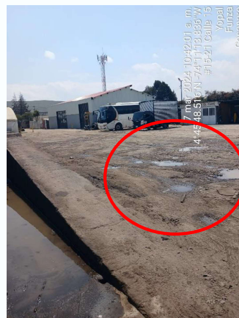
Ilustración 8. Anegación