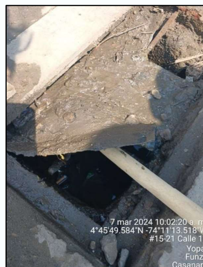
Ilustración 3. Canal 1 y caja 1