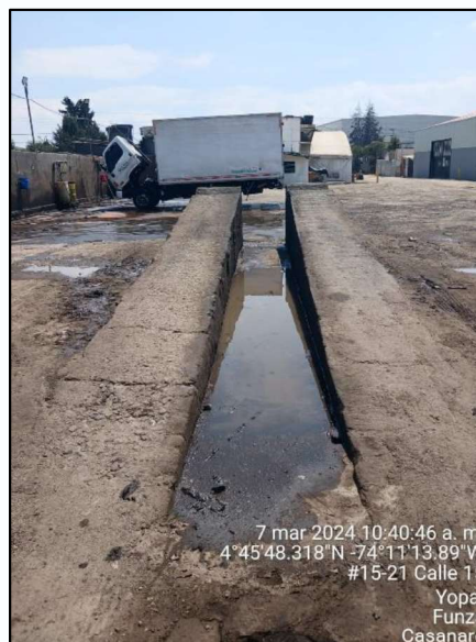
Ilustración 6. Área de lavado y cárcamo