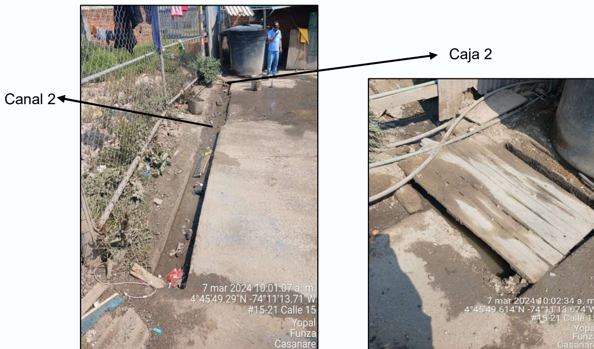
Ilustración 4. Canal 2 y caja 2

La totalidad del agua residual generada en el proceso de lavado de automotores no se conduce a los canales, por lo tanto, se observa anegamiento en el suelo.