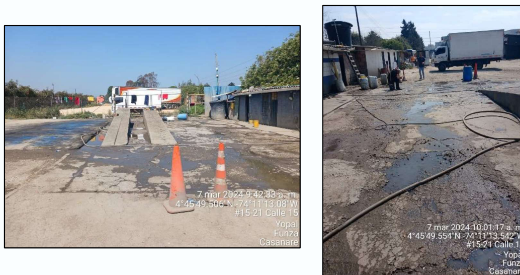
Ilustración 5. Anegación

La totalidad del agua residual generada en el proceso de lavado de automotores no se conduce a los canales, por lo tanto, se observa anegamiento en el suelo.